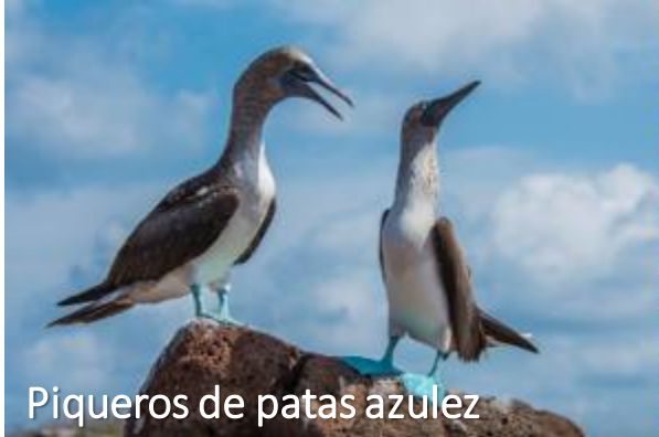
Piqueros de patas azules