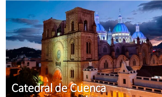
Catedral de Cuenca