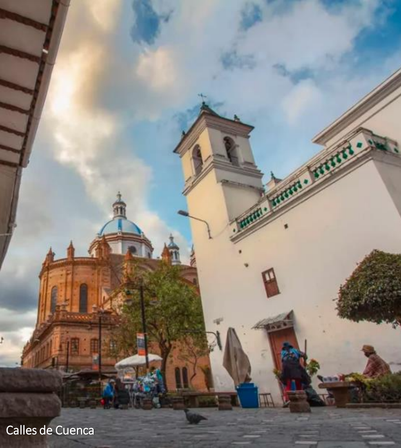
Calles de Cuenca