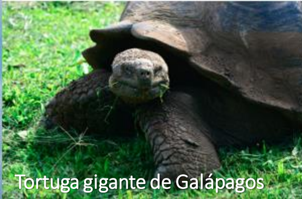
Tortuga gigante de Galápagos