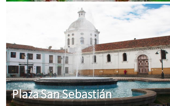
Plaza San Sebastián