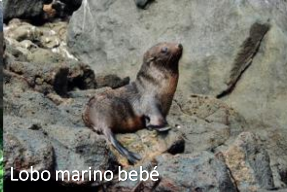
Lobo marino bebé