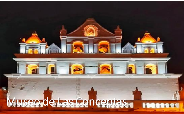
Museo de Las Conceptas