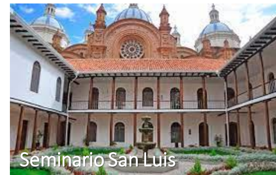
Seminario San Luis