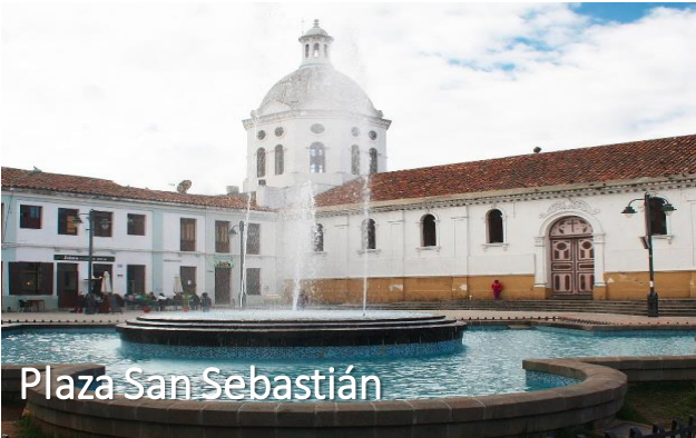
Plaza San Sebastián

Opción 2: Recorrido nocturno por Cuenca - puede realizar este recorrido cualquiera de las siguientes noches: 26, 27 o 28 de septiembre