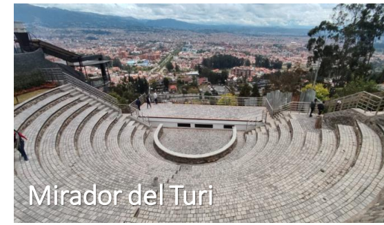
Mirador del Turi