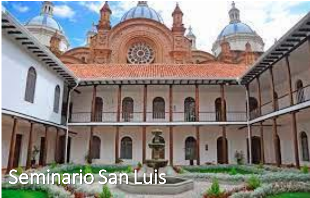
Seminario San Luis