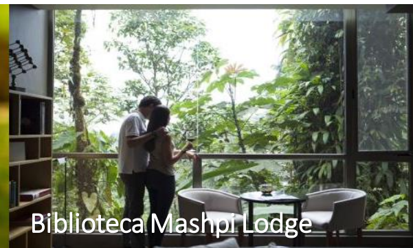
Biblioteca Mashpi Lodge